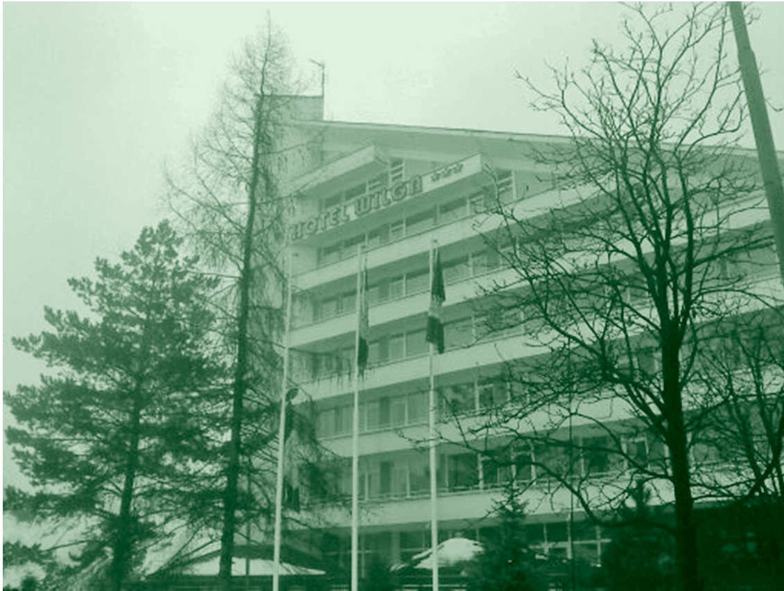
Sanatorium Uzdrawiskowe Ustroń S.A.