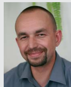
Pan Grzegorz z Oddziału ZUS w Rzeszowie

ZUS to poważna instytucja. Ale „poważna” wcale nie musi oznaczać, że ponura. Pracownicy Zakładu potrafią się uśmiechać i chętnie to robią. A z okazji Świąt i Nowego Roku uśmiechają się także do Państwa. A „ZUS dla Ciebie” wszystkim swoim Szanownym Czytelnikom życzy dużo radości!